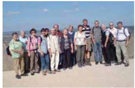
Pilgergruppe auf der Wurmlinger Kapelle

Ende September führte eine Tagesetappe von Tübingen nach Rottenburg. An einem wunderschönen Spätsommertag machte sich eine 14-köpfige Pilgergruppe auf den Weg nach Tübingen. Nach einer Andacht in der Tübinger Jakobuskirche gesellte sich spontan ein weiterer Betzinger zu unserer Gruppe. Der Weg führte über den Schlossberg durch den schattigen Wald zur Wurmlinger Kapelle. Der letzte Wegabschnitt führte über weite Felder bei sommerlicher Hitze nach Rottenburg in den Dom. Gute Gespräche und überraschende Begegnungen füllten den Tag. Mal wieder hat sich bewahrheitet: Wer sich auf den Weg macht, der gerät in Bewegung und erhält neue Einsichten in das Leben und in die Welt, in der wir leben.